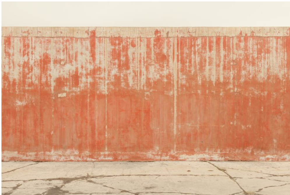
China 3, Ink Jet Print on Hahnemuhle Ultra Smooth Paper, 2013 – courtesy Galleria Carla Sozzani.

Prima monografia dedicata all'artista, la fatica editoriale, curata da Demetrio Paparoni ed edita da Skira, raccoglie una serie di interessantissimi saggi firmati da Barry Schwabsky, Aldo Nove, Philip Tinari e un'intervista a William Ewing, una fra le più colte e prestigiose voci nel panorama della critica mondiale. Il catalogo presenta al pubblico una selezione di immagini realizzate dal 2008 a oggi, dove l'attenzione al dettaglio della stampa ha portato a un lungo e sinergico lavoro sviluppatosi fra l'editore, il curatore e lo stesso fotografo.