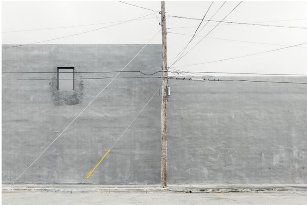
Miami 4, Ink Jet Print on Hahnemuhle Ultra Smooth Paper, 2011

Ljubodrag Andric è una persona molto elegante e disponibile che, cresciuto in una terra dilaniata dalla guerra ma ricca di un profondo amore per il sapere, propone una ricerca artistica dove quella necessaria capacità di sfruttare gli strumenti della “società dello spettacolo”, per emergere dal caos di immagini e sollecitazioni che ci circonda, è declinata in una raffinata visione personale. Le sue immagini, prive di ogni coordinata temporale, non raccontano nulla e nulla concedono alla narrazione ma sfruttano la loro bellezza perfetta, estraniante, per parlarci di tematiche profonde quali i limiti invalicabili, i vuoti e le assenze , tematiche, raccontate con ferma raffinatezza, oggi attualissime e drammatiche, in questo nostro “secolo delle erranze”.